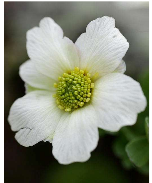
この時期のみの必見！キタダケソウ

※小屋は7月から混雑。4/1から予約のため4/12までの申込者で一旦予約、その後空きがあれば追加